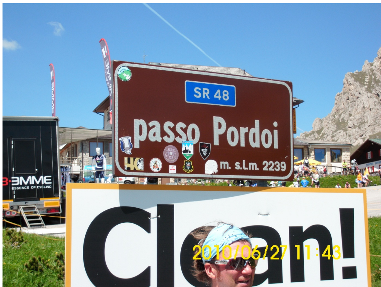
Die An-Aussichten werden immer Traumhafter