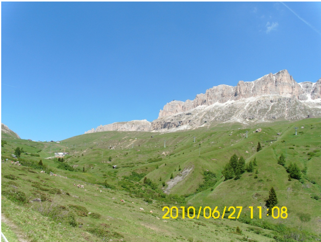
Und noch ein Pass das Pordoijoch