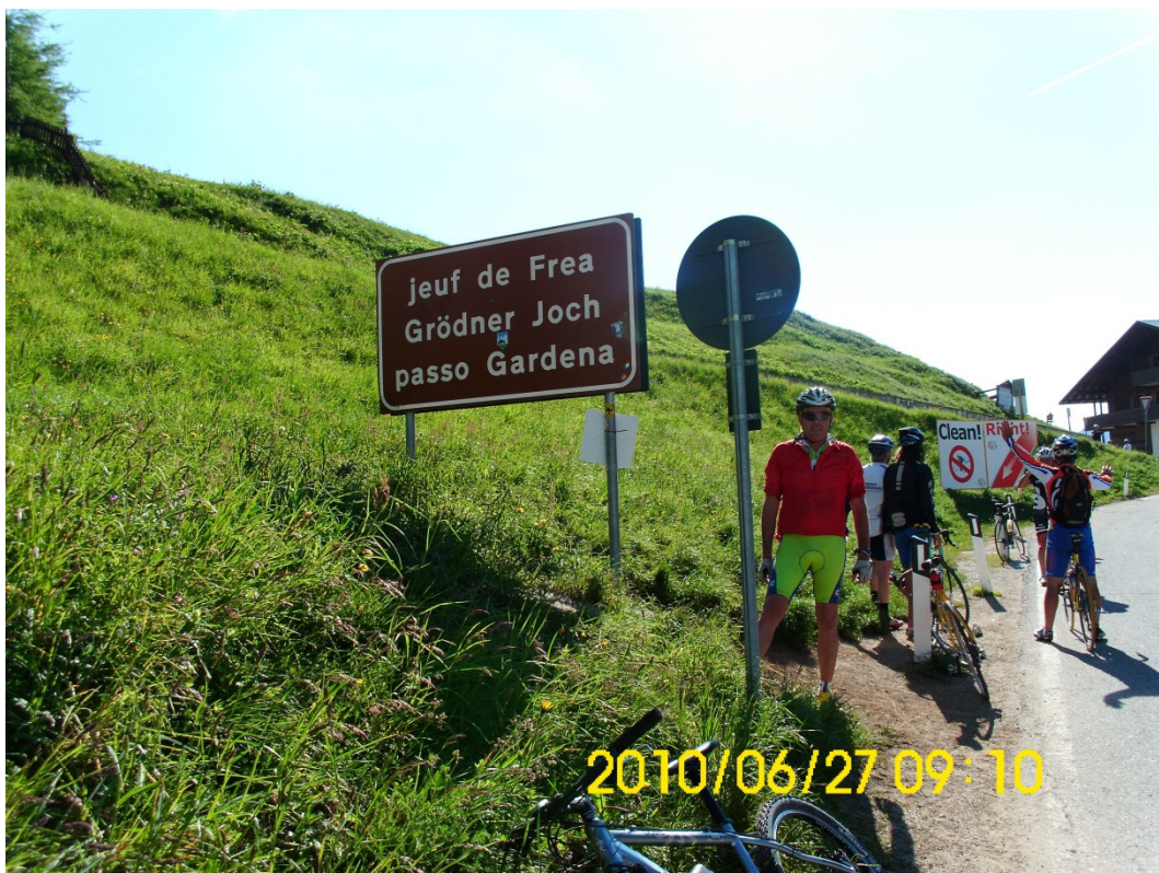
Die ersten Höhenmeter sind geschafft