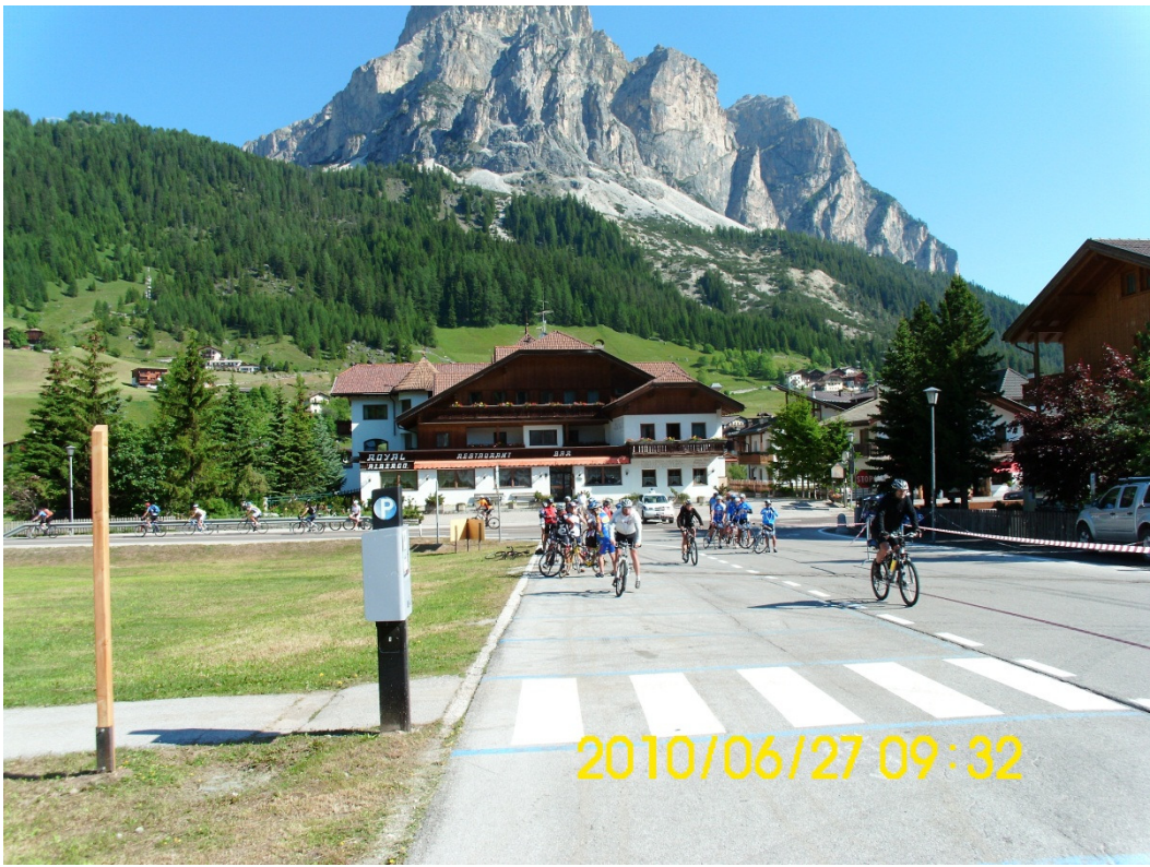
BORMIO in Süd Tirol