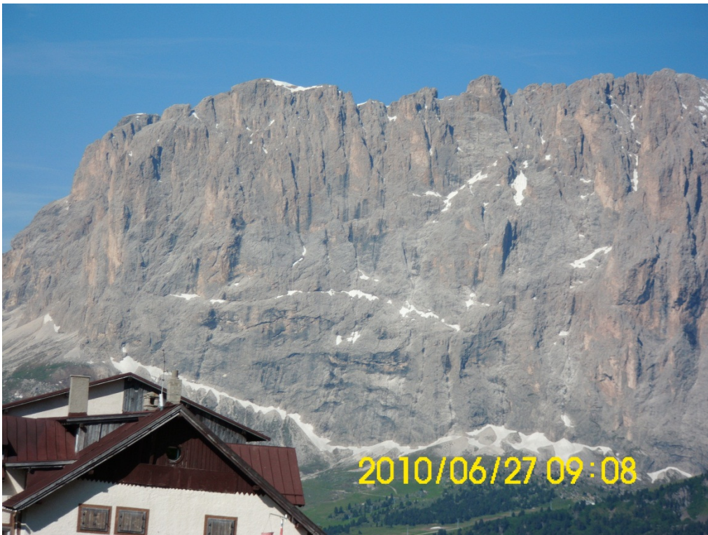
Eine Traumhafte Kulisse